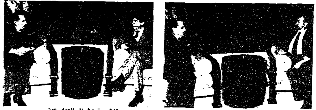
العماد عون مع السفير الإسباني